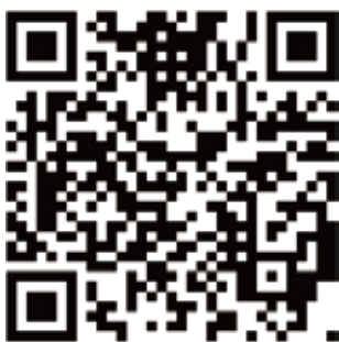
伊勢市電子図書館

か電子図書館に入っていない本の続きを求めて図書館へ足を運んでくれる子どもたちもいて、図書館の利用促進の機会になっていると感じました。続刊で所蔵のないものまでできるだけ購入をして対応しています。現段階では試験導入ということで児童書のみですが、時代の変化や幅広いニーズに対応していければと考えています。