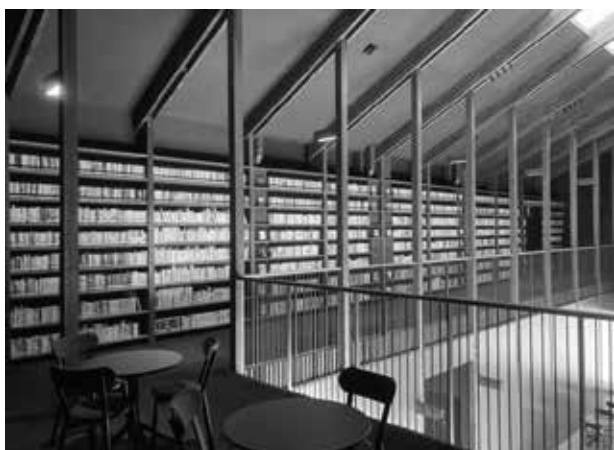
いがまち図書室内観