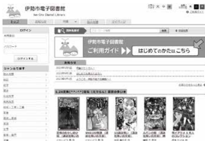
伊勢市電子図書館

電子図書館のサイトのトップページに掲載される特集は、伊勢市出身の作家作品を集めた「伊勢市出身の作家さん」、映像化された本を集めた「読んでよよし。見てもよし。」、小学生が大好きな怖い本を集めた「ぞく…ぞく…ぞくっ…」など様々な特集を組んでいます。