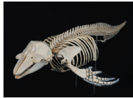
スナメリ 骨格標本