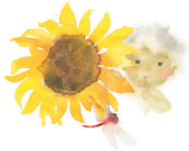
いwasaki chihiro 《ひまわりとあかちゃん》 1971年 ちひろ美術館蔵